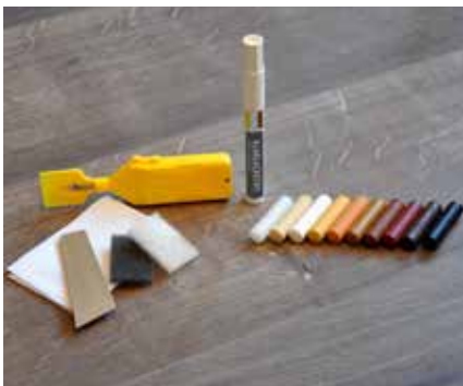
Hartwachs-Reparaturset Artikel-Nr. 1101060150

Für die Reparatur von kleinen Schäden in Bodenoberflächen (z.B. Kratzer, Druckstellen, kleine Löcher).